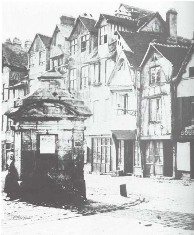
Fontaine détruite vers 1869