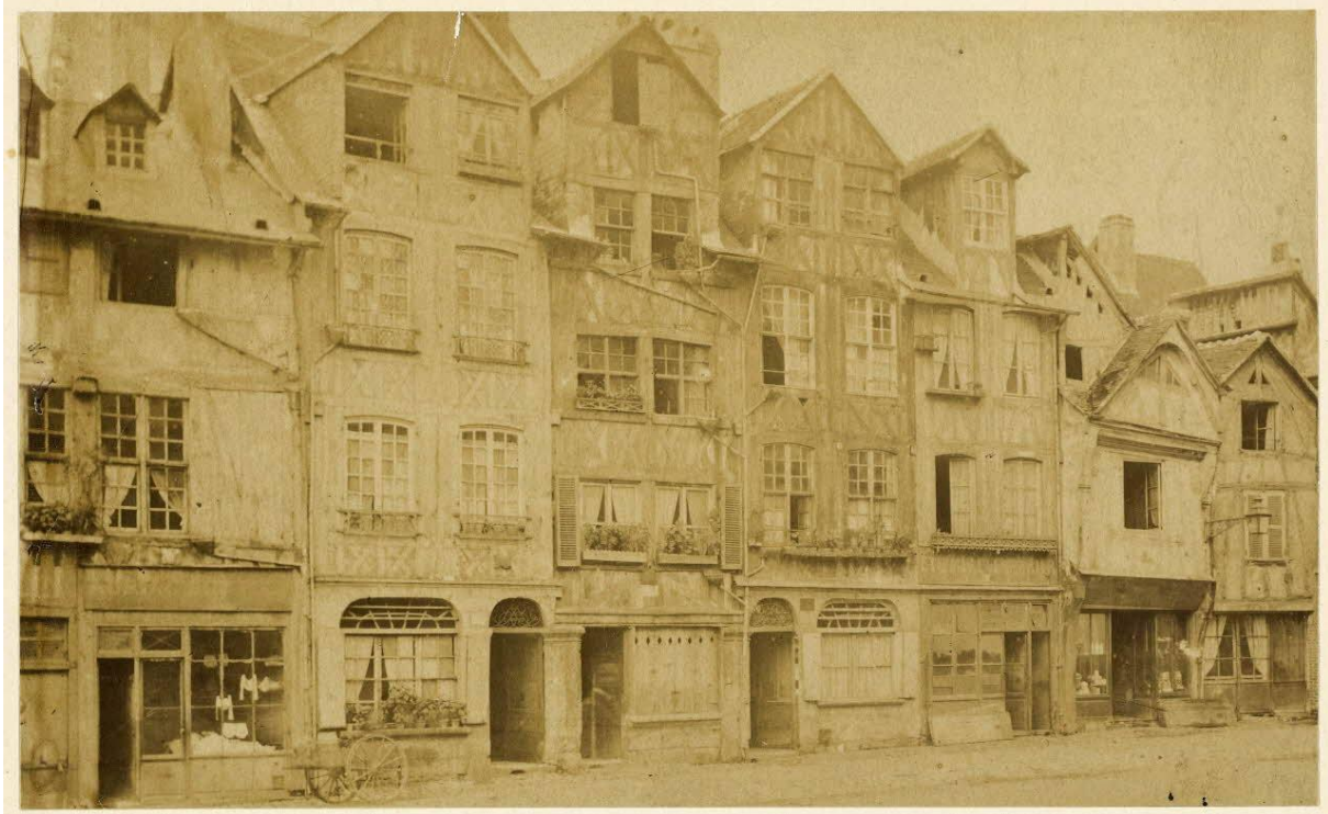
Rue des Faulx aux environs de 1900