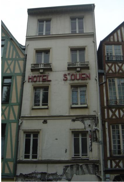
Hôtel St Ouen , avant restauration , au N° 43