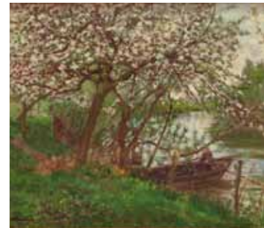
Le port de Maria, huile sur toile, limite 19 e - 20 e siècle

Saint-Christophe, font clairement référence à l'impressionnisme. Dans tous les cas, la composition reste classique, le plus souvent frontale ( Les Moyettes dans la plaine ) ou rayonnante ( Les Moutons sur la route du château ). Ces paysages sont aujourd'hui encore aisément identifiables et font des œuvres de Bouchor de véritables témoignages de l'évolution de la topographie du village depuis un siècle.