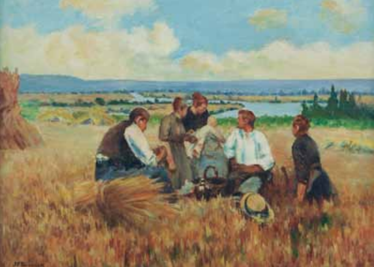
La collation des moissonneurs, huile sur toile, limite 19 e - 20 e siècle

les jours du monde agricole : La cour de la ferme, La collation des moissonneurs, Le cidre nouveau, La cueillette des pommes... Un quotidien au rythme immuable, dans lequel la technologie n'a pas de place : pas de véhicule à moteur mais des outils de bois, des paniers d'osier et des barques glissant sur l'eau. Aucun drame, aucune violence, sauf sur le cochon que l'on flambe sur la place du village ! « Monsieur Bouchor voit la campagne avec des yeux de poète » écrit en 1892 dans L'Illustration , le critique d'art Alfred de Lostalot. S'il pratique, comme d'autres artistes de son temps, ce que Maupassant nomme, d'une manière un peu péjorative, « le genre paysan », il le fait avec sensibilité, prompt à