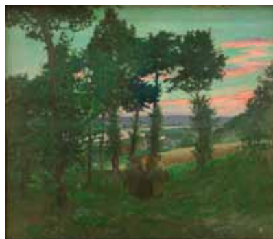
Un soir au temps des moissons, huile sur toile, limite 19 e - 20 e siècle

Pour peindre ce tableau, Bouchor s'est placé à mi-pente de la crête, au-dessus des maisons. Le couvert végétal est plus important aujourd'hui et le cours de la Seine différent, le coude de la Bosse des Vannes, bien visible en arrière plan, ayant été remblayé vers 1930.